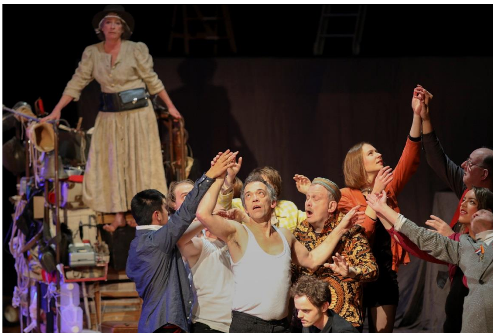
(Beeld uit: Courage )

Daar zijn we trots op, net zoals we trots zijn op de enthousiaste inzet en steun van alle spelers, bezoekers, medewerkers, vrijwilligers, subsidiënten, sponsors en allen die Carte Blanche een warm hart toedragen.